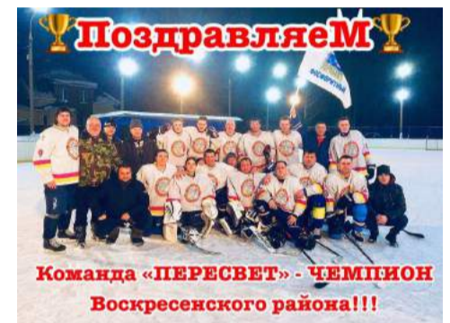
Команда «ПЕРЕСВЕТ» - ЧЕМПИОН Воскресенского района!!!

Коллектив АМУ «КПСЦ Родник» поздравляет команду «Пересвет» с победой в первенстве Воскресенского района по хоккею!